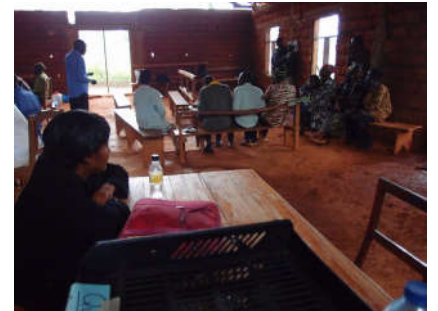
2 Computers en boeken weggeborgen, en sommige deelnemers schuilen tussen de ramen tot de regen over is

Als het regent, dan krijg je een hoop herrie op het golfplaten dak. Maar de deelnemers blijven gewoon doorgaan, hoewel je elkaar amper kunt verstaan. Het kan wel zijn dat mensen ergens anders gaan zitten, want je kan