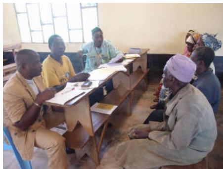
1 Banken op elkaar als tafel

Wat gelijk blijft is het enthousiasme van de deelnemers, de inventieve oplossingen, en de vermoeidheid aan het einde van een werkdag.