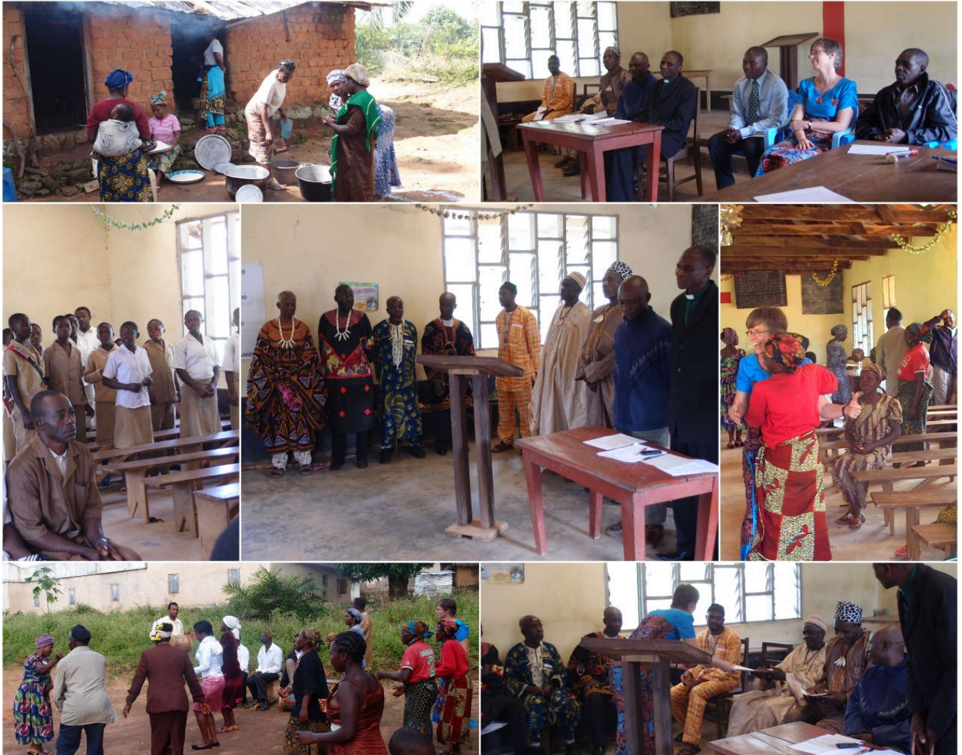
3 Laatste dag van de workshop: vrouwen koken een feestmaal, een ceremonie met o.a. toespraken, dan eten, en vervolgens dansen. Midden: vier subchefs (I) en drie koningen zijn aanwezig bij de plechtigheid.